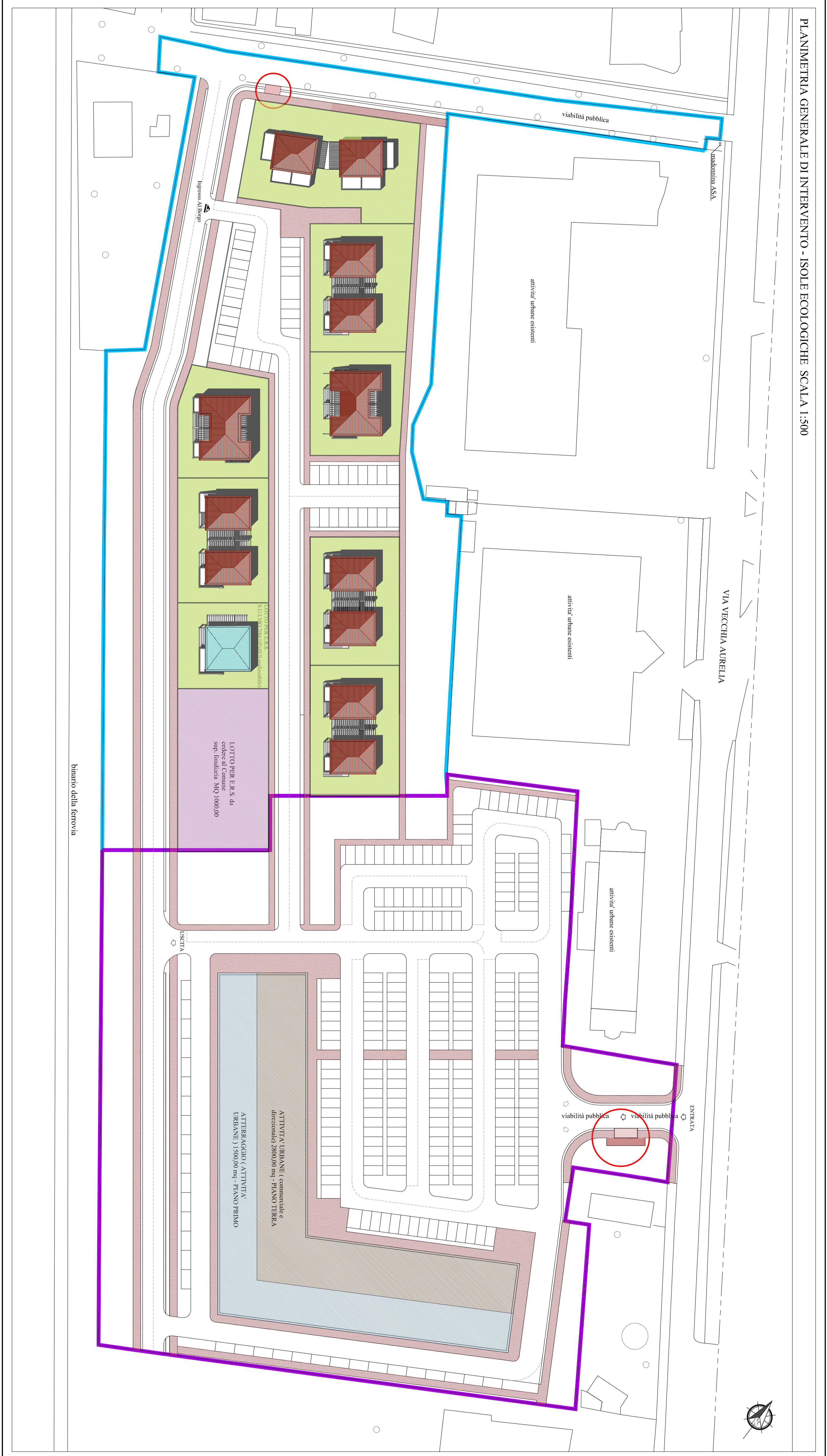
PLANIMETRIA GENERALE DI INTERVENTO - ISOLE ECOLOGICHE SCALA 1:500