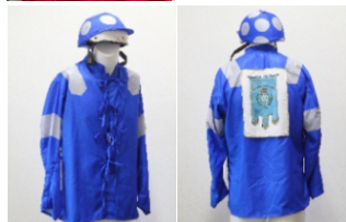
Comune di Rosignano