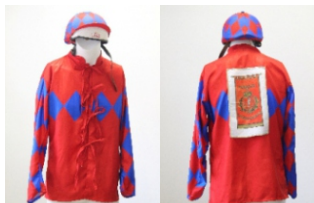
Comune di Campiglia