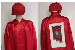
Comune di Livorno