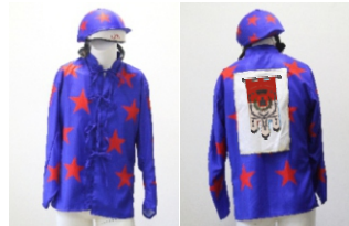
Comune di Sassetta