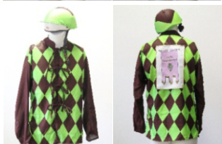
Comune di Castagneto