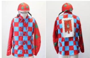
Comune di Bibbona