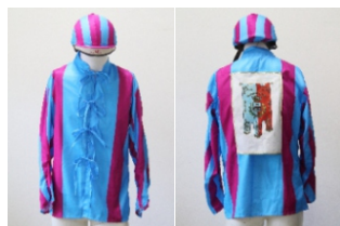
Comune di Cecina