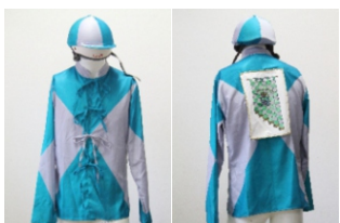
Comune di Suvereto