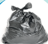
Sacchi grandi ad uso domestico