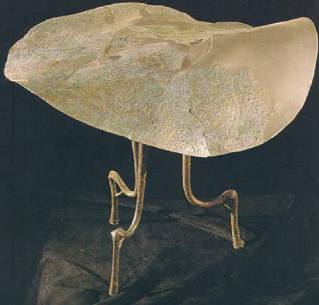
Tavolino in bronzo - Necropoli di Casa Nocera